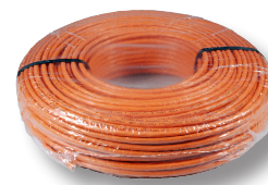
100 m Ring