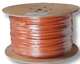
500/1000 m Trommel