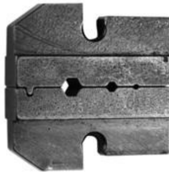
Produkt im Warenkorb