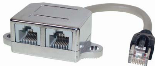
RJ 45 Plug – 2x RJ 45 Jack Telefon/Ethernet