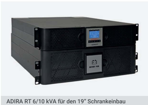
ADIRA RT 6/10 kVA für den 19" Schrankeinbau