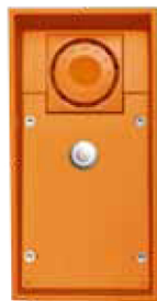
2N® EntryCom IP Safety