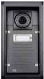
2N® EntryCom IP Force