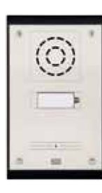
2N® EntryCom IP Uni

Mit der 2N® EntryCom IP Produktfamilie stehen Ihnen SIP Türsprechstellen für vielfältige Einsatzumgebungen zur Verfügung. Egal ob als elegantes Türtelefon im Geschäftsbereich oder als besonders widerstandsfähige Sprechstelle in rauen Umgebungen, innerhalb der 2N® EntryCom IP Produktfamilie finden Sie die passende Lösung!