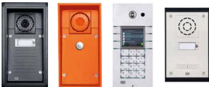
2N®EntryCom IP Force