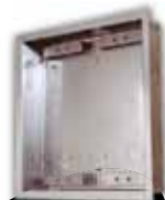
9135352D UP-Gehäuse für 2 Module