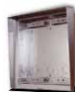
9135362D Wetterschutzrahmen und UP-Gehäuse für 2 Module