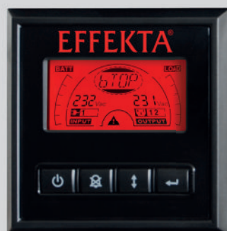
Bild links: Auf dem benutzerfreundlichen Bedienpanel ist auf den ersten Blick der Betriebszustand der USV anhand der Hintergrundbeleuchtung erkennbar.